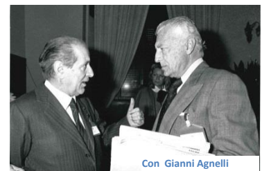
Con Gianni Agnelli

un poco alla volta si trovò nel Ghota della finanza, che però utilizzò con accortezza e sempre come strumento a vantaggio dell'industria.